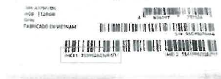
Imagen referencial Tag celular