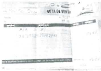
Imagen referencial nota de venta