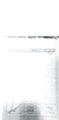
Nota de venta