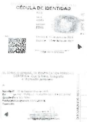
Anverso y reverso de la cedula de Identidad

-Para el registro de Televisores, Monitores, Refrigeradores y/o Lavadoras, el participante debe subir en el registro fotos de documento de venta, la póliza de garantía del producto debidamente llenada a nombre de la persona que está haciendo el registro, el Tag cortado del producto o foto de la placa donde se encuentra el serial del producto, en el registro se debe colocar el número de SERIAL y por último debe subir la foto del original de la cedula de identidad anverso y reverso.