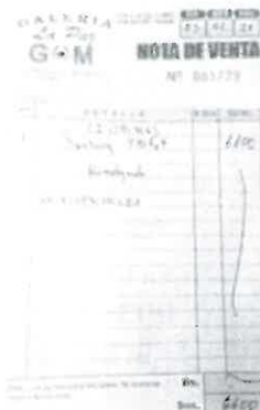
Nota de venta