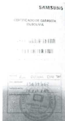
Poliza de garantia