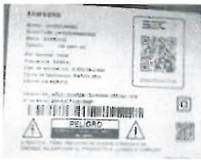
Plaqueta con el serial del producto