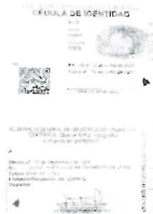
Anverso y reverso de la cedula de identidad

-Para el registro de Tablets, Relojes inteligentes y audifonos se deben subir fotos de documento de venta, el tag del producto cortado y en el registro se debe colocar el número de SERIAL y se debe subir foto del original de la cedula de identidad anverso y reverso.