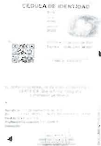
Anverso y reverso de la Cédula de Identidad