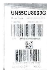
Tag del producto