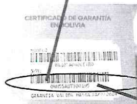
POLIZA O CERTIFICADO DE GARANTIA