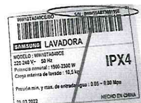
PLACA DEL PRODUCTO